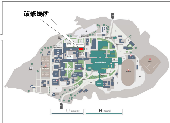
杉谷キャンパス 配置図